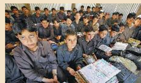
Schule in Kaschmir.

Jugendliche erhalten die Chance auf eine Ausbildung, um später als Elektriker oder Schreiner ihren Lebensunterhalt zu verdienen. Frauen, die ihre Männer auf der Flucht verloren haben, erhalten finanzielle Hilfe. So können sie sich durch ein Kleingewerbe, wie etwa eine Nutztierzucht, ein Einkommen erwirtschaften und ihre Kinder ernähren.