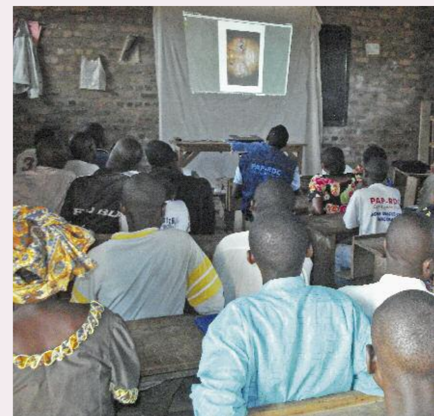
Informationsveranstaltungen von PAP sind gut besucht