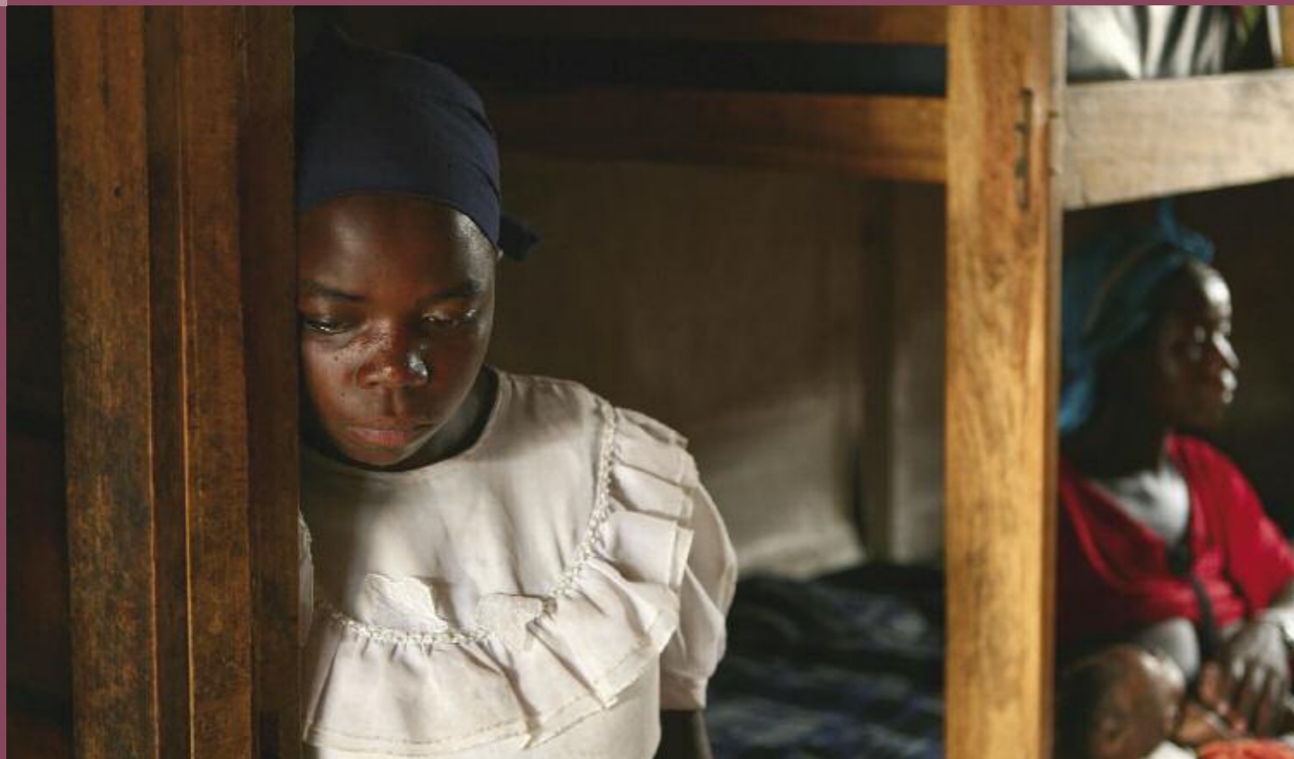
Minderjähriges Opfer von sexueller Gewalt in einem Waisenhaus in Goma