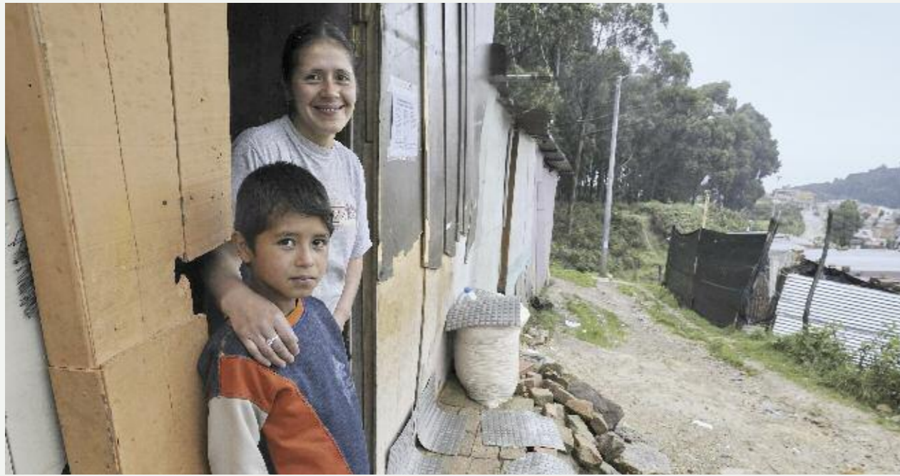
Das Wissen um die Gefahren von Minen und Blindgängern ist überlebenswichtig