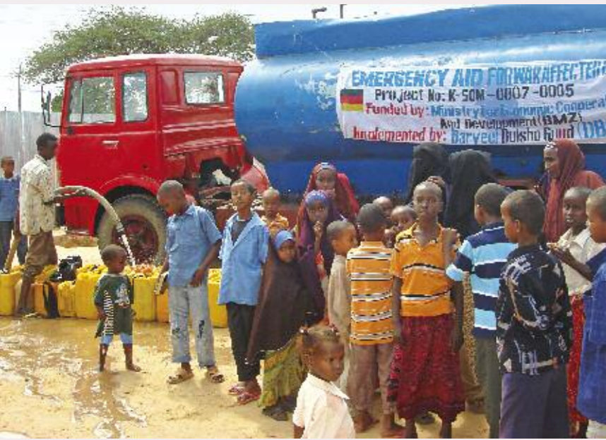
Tanklaster versorgen Flüchtlinge mit Trinkwasser