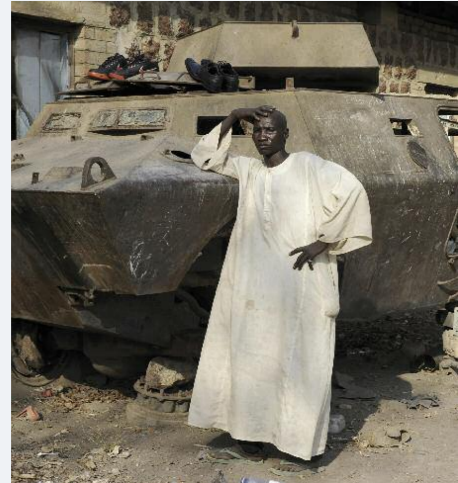
Zerstörter Panzer im Sudan

als Beitrag zum Frieden in immer wieder neuen Konstellationen in der Arbeit vor Ort