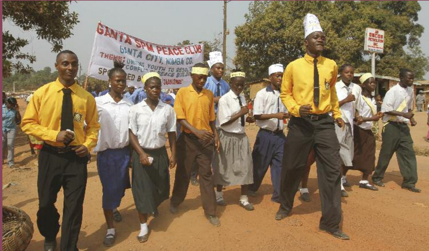
Jugendliche protestieren für ein friedliches Zusammenleben