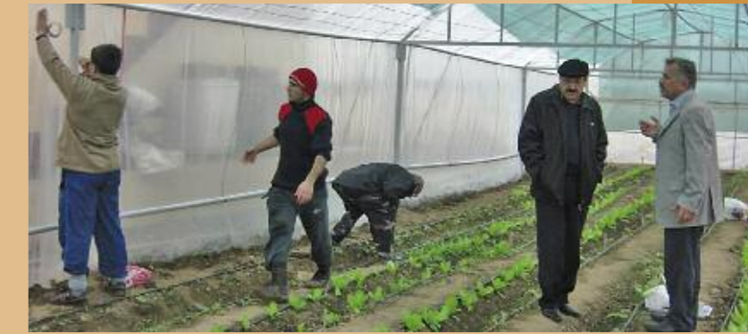
Bau eines Gewächshauses

Der Nordirak war einst von einer großen ethnischen und religiösen Vielfalt geprägt. Saddam Husseins Arabisierungspolitik hat das friedliche Zusammenleben jedoch zerstört. Kurden und Turkomanen wurden vertrieben und loyale arabische Volksgruppen angesiedelt. Die christliche Minderheit im Nordirak war von der systematischen Arabisierung ebenfalls betroffen. Viele mussten ihre Heimat verlassen oder gerieten zwischen die Fronten der kurdischen Peshmerga und der irakischen Armee. Christen aus den ländlichen Regionen suchten Zuflucht in den großen Städten. Doch heute ist die Sicherheitslage dort so prekär, dass viele wieder aufs Land zurückkehren. Die meisten Vertriebenen und Rückkehrer kommen entweder bei Gastfamilien unter oder in leer stehenden Gebäuden. Weil es in den verfallenen Dörfern aber keine ausreichende Infrastruktur gibt, stehen die Familien zunächst vor dem Nichts. Es fehlt an Einkommensmöglichkeiten, ausreichenden Nahrungsmitteln, angemessenen Wohnverhältnissen, Bildungseinrichtungen und einer medizinischen Versorgung.