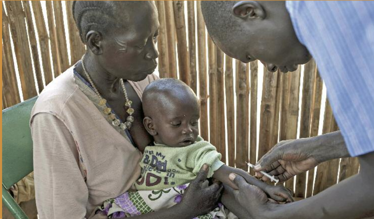
Kinderschutzimpfung in der Gesundheitsstation von Rumbek