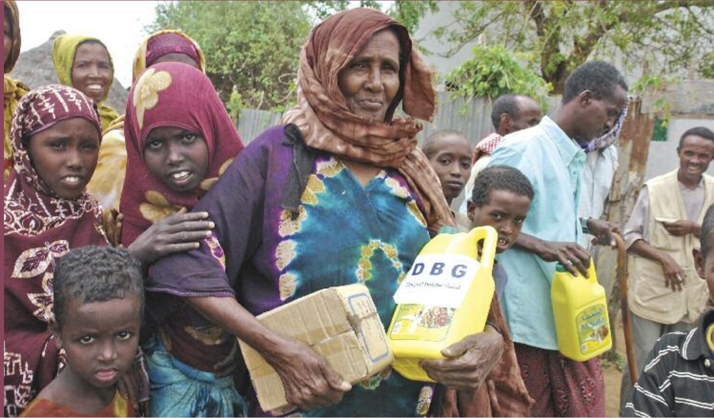
In einem Flüchtlingslager erhalten Familien Grundnahrungsmittel