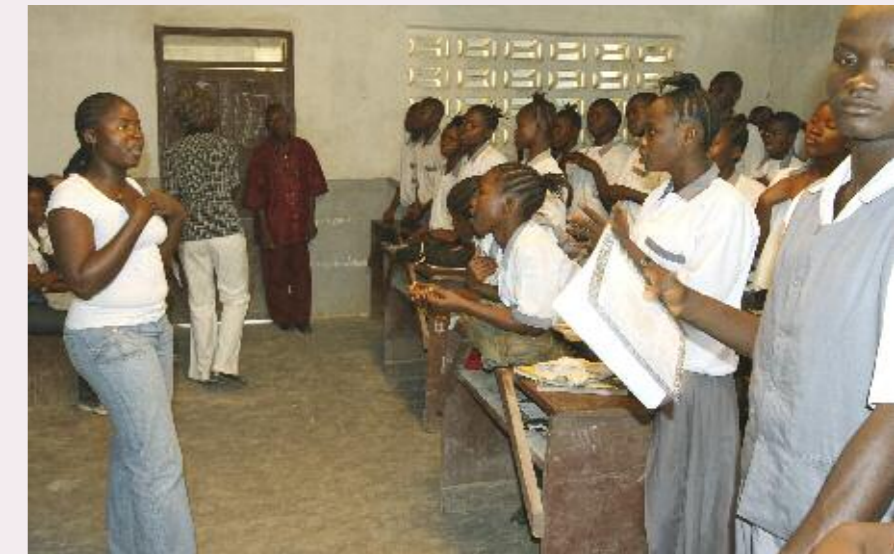
An 15 Schulen ist Traumaarbeit ein fester Bestandteil des Unterrichts