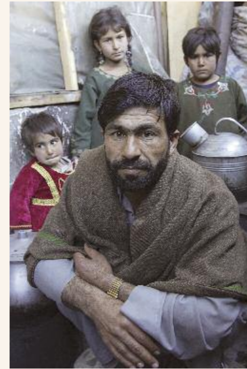
Flüchtlingsfamilie in Kabul