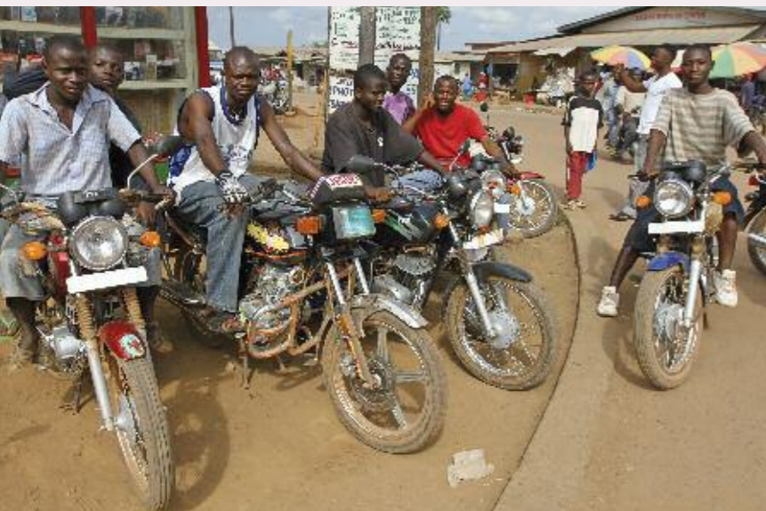
Motorradtaxi in Ganta