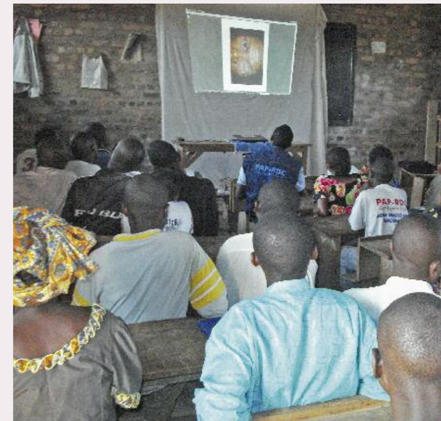
Informationsveranstaltungen von PAP sind gut besucht