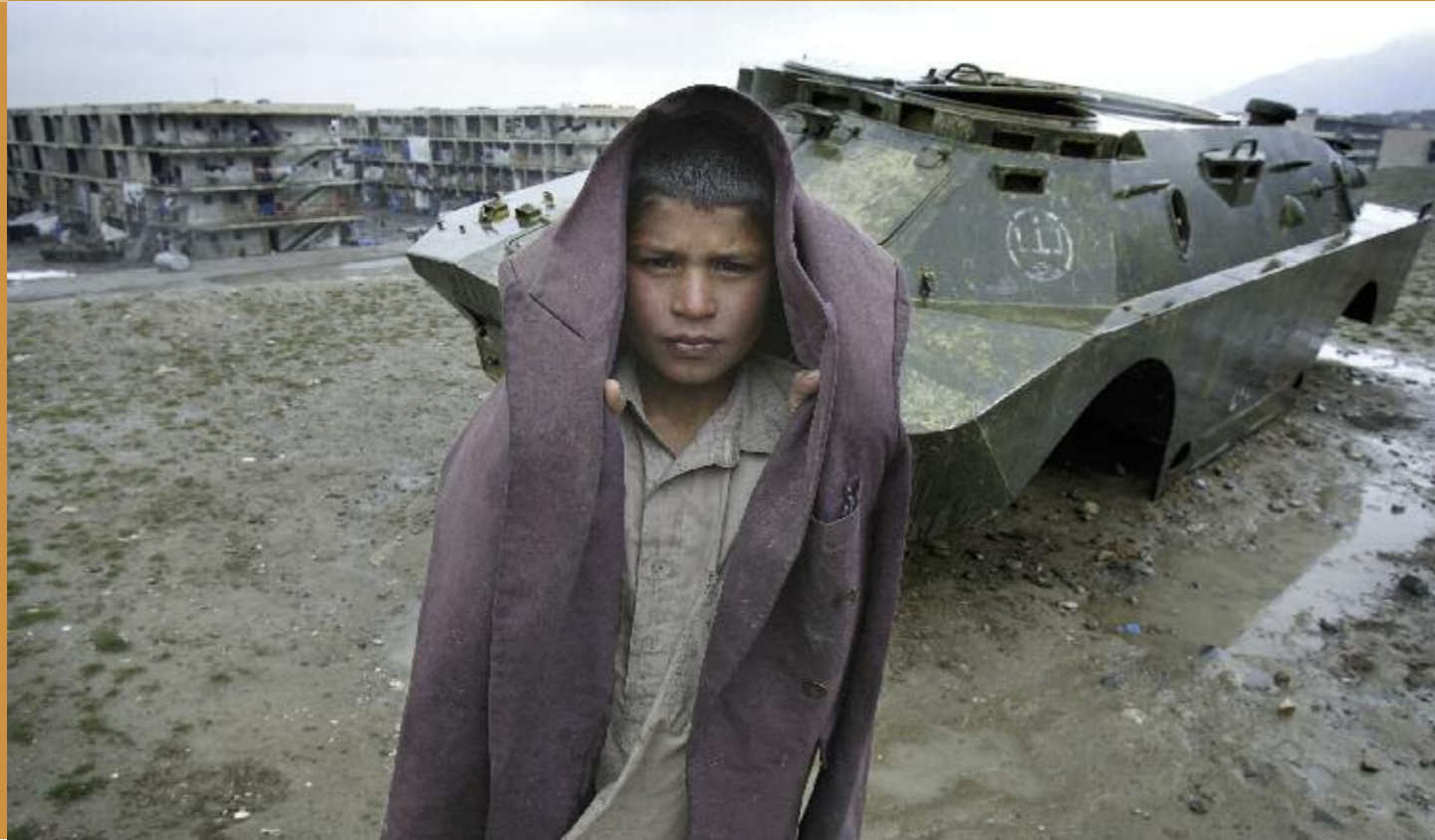
Flüchtlingsjunge in Kabul vor dem Wrack eines russischen Aufklärungspanzers