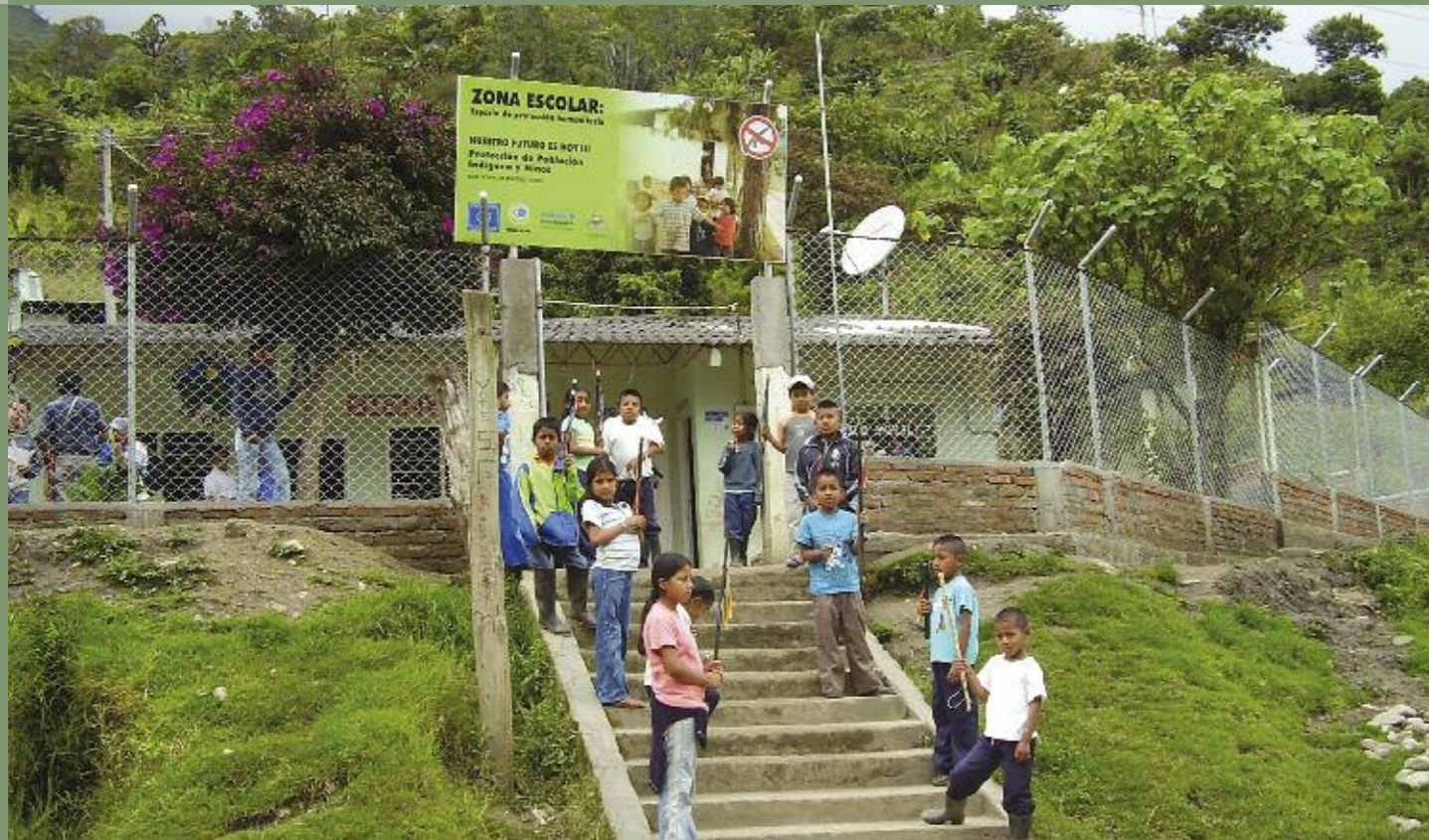
Eine Schule in Cauca hat sich zur humanitären Zone erklärt