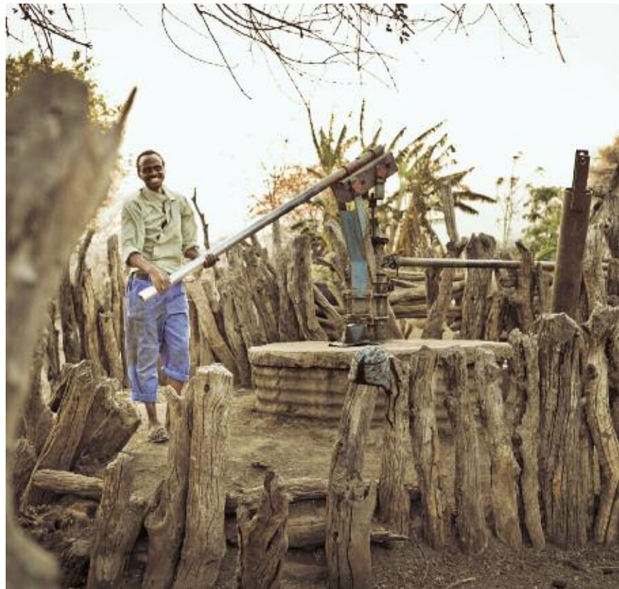
Tiefbrunnen in Simbabwe.

Die Gesamtaufwendungen der Diakonie Katastrophenhilfe waren im Berichtsjahr mit 35,5 Millionen Euro um 26 Prozent höher als im Vorjahr (28,8 Millionen). Die satzungsgemäßen Aufwendungen für Hilfsprojekte, Projektbegleitung und Öffentlichkeitsarbeit betragen 2010 32,1 Millionen Euro (Vorjahr 26,8 Millionen Euro) und somit 90,4 Prozent der Gesamtausgaben (Vorjahr 93,2 Prozent). Die Aufwendungen für Werbung und Verwaltung sind um 75,2 Prozent gestiegen. Die Zunahme ist insbesondere eine Folge vermehrter Werbemaßnahmen und erhöhter Aufwendungen für die Spendenbuchhaltung aufgrund des stark angestie-